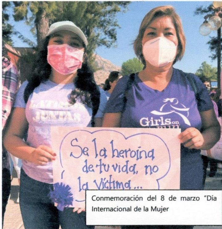
Conmemoración del 8 de marzo "Día Internacional de la Mujer"