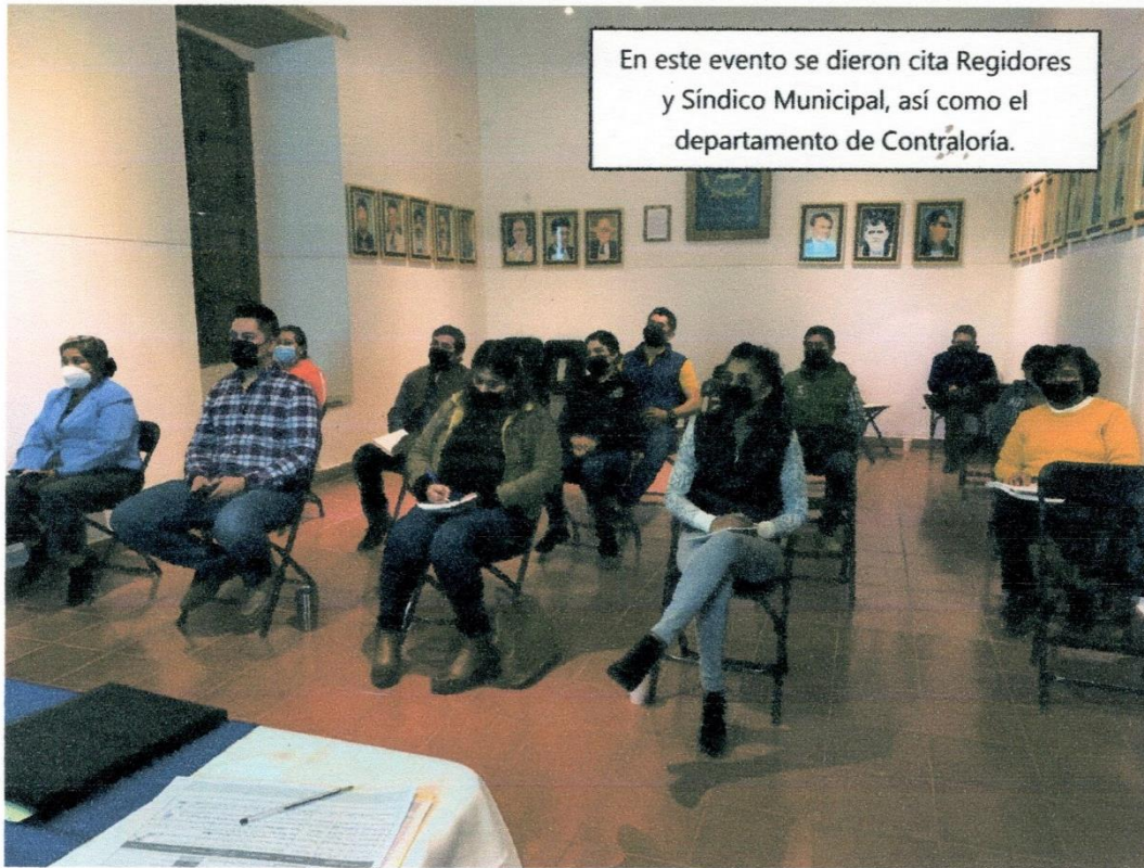
En este evento se dieron cita Regidores y Síndico Municipal, así como el departamento de Contraloría.