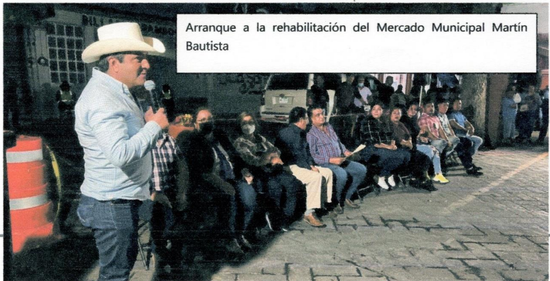
Arranque a la rehabilitación del Mercado Municipal Martín Bautista