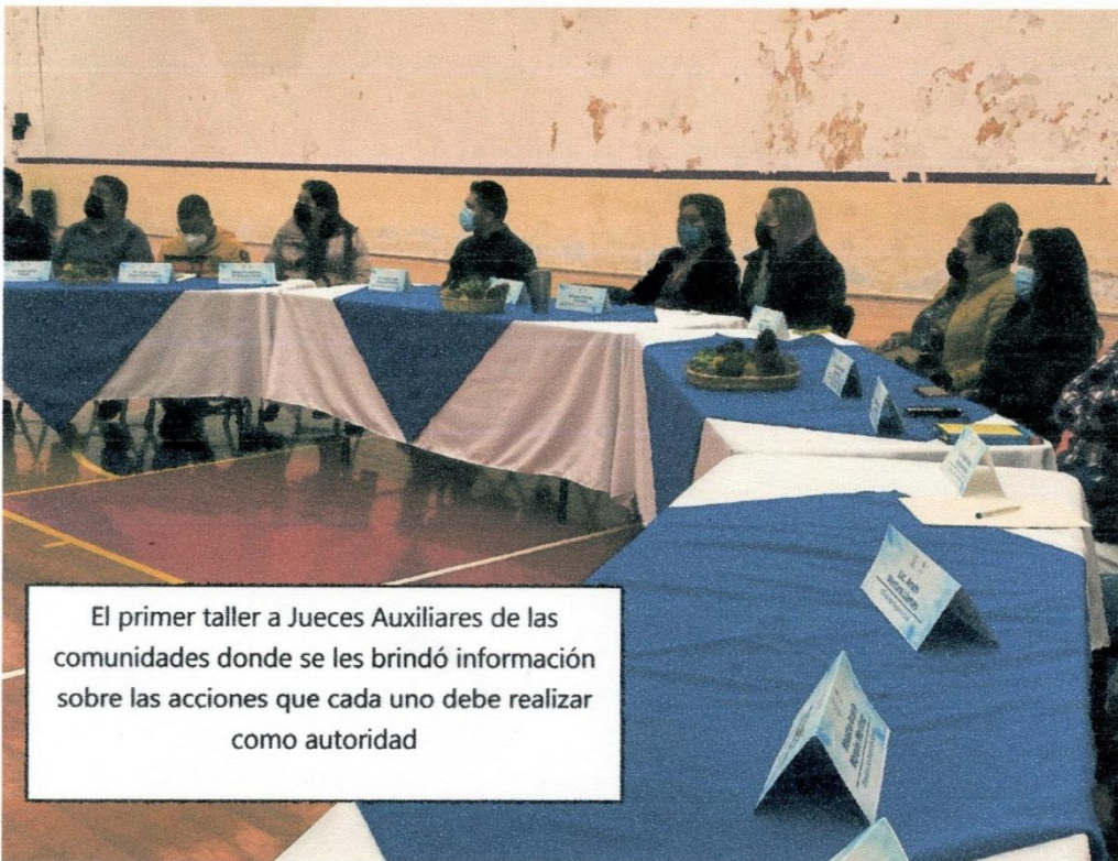
El primer taller a Jueces Auxiliares de las comunidades donde se les brindó información sobre las acciones que cada uno debe realizar como autoridad